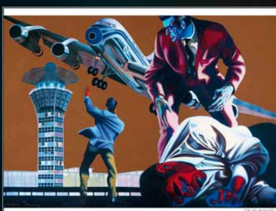
"Vol 3 - L'Avion" Vinylique sur toile (2008) 135 x 201 cm