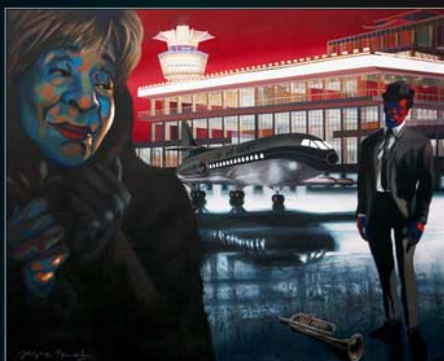
"Vol 11 - Le Tarmac" Vinylique sur toile (2011) 152 x 190 cm