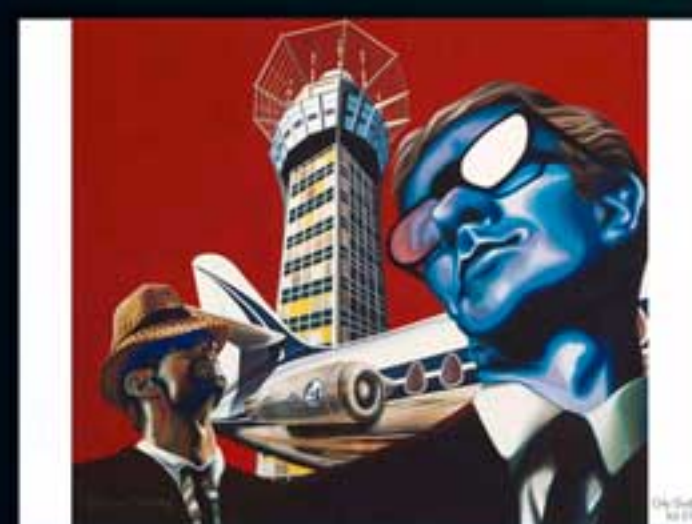
"Vol 1 - La Tour" Vinylique sur toile (2008) 126 x 145 cm

Du 20 janvier au 3 mars jeudi - vendredi - samedi 14 h / 18 h