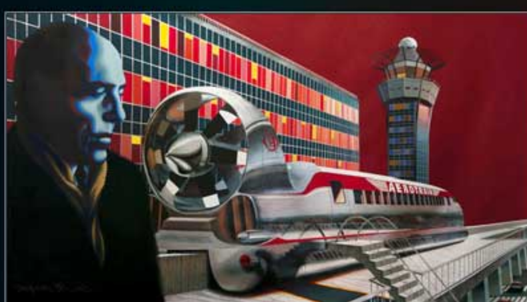
"Vol 9 - L'Aérotrain" Vinylique sur toile (2011) 113 x 201 cm