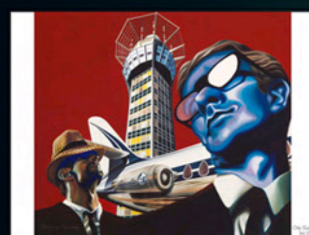
"Vol 1 - La Tour" Vinylique sur toile (2008) 126 x 145 cm

Du 20 janvier au 3 mars jeudi - vendredi - samedi 14 h / 18 h