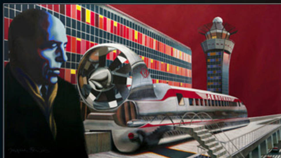
"Vol 9 - L'Aérotrain" Vinylique sur toile (2011) 113 x 201 cm