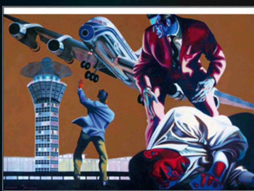
"Vol 3 - L'Avion" Vinylique sur toile (2008) 135 x 201 cm