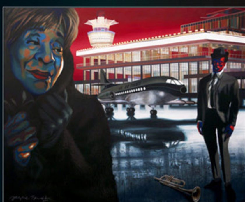
"Vol 11 - Le Tarmac" Vinylique sur toile (2011) 152 x 190 cm